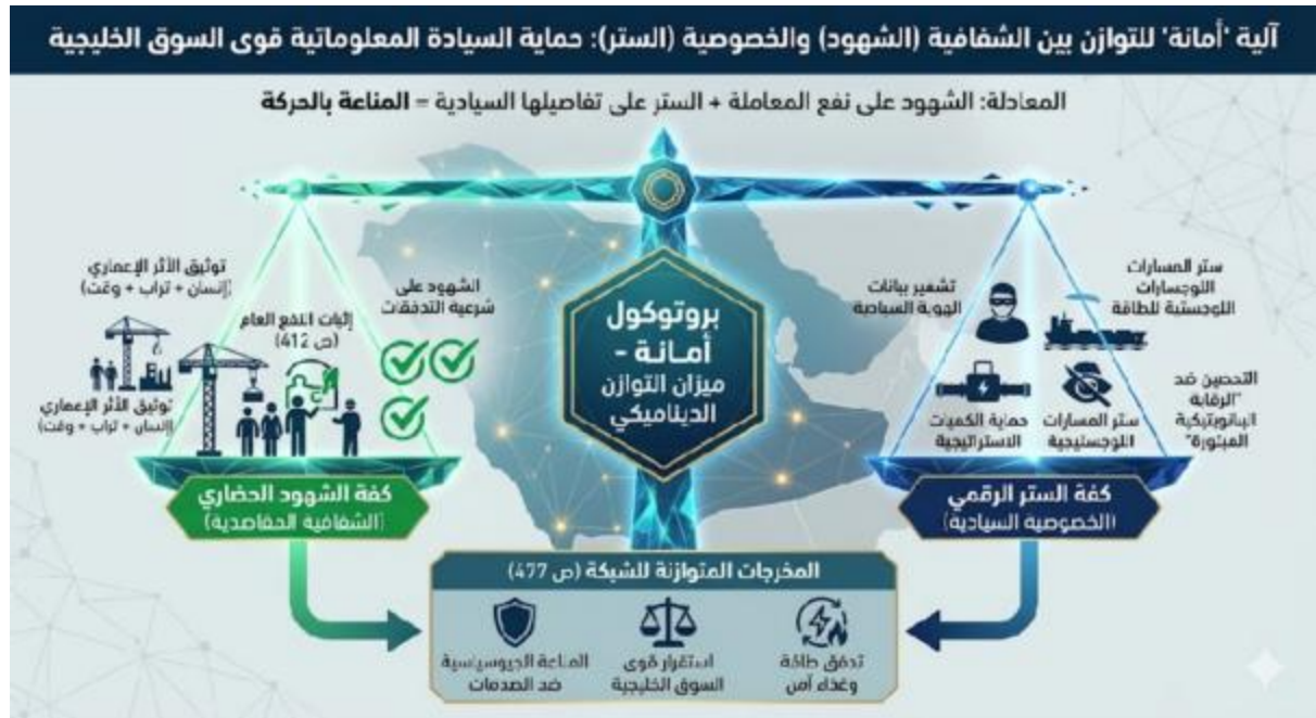
[شكل رقم ٩]: ميزان "أمانة" للتوازن بين الشفافية (الشهود) والخصوصية (الستر)

"الحرية المسؤولة" ويمنع "الرقابة الشمولية" الدولية على الاقتصاد الخليجي.