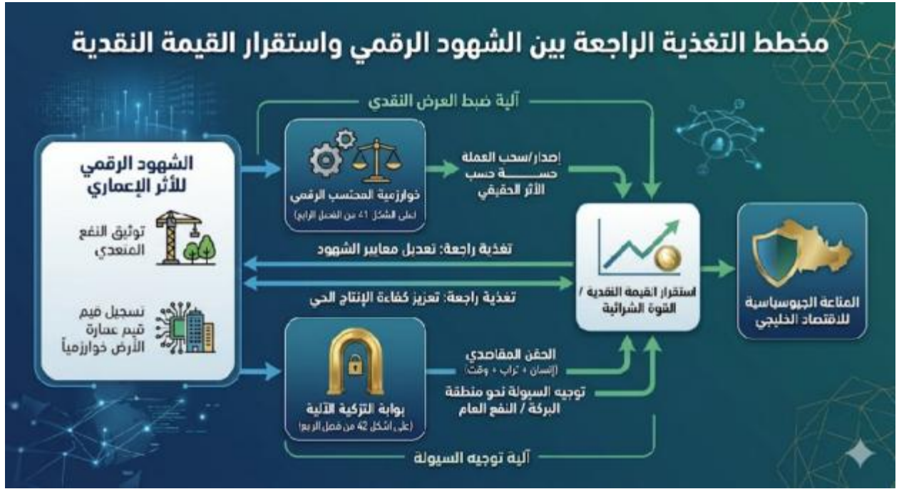
[شكل رقم ٦]: مخطط التغذية الراجعة بين "الشهود الرقمي" و"استقرار القيمة النقدية"