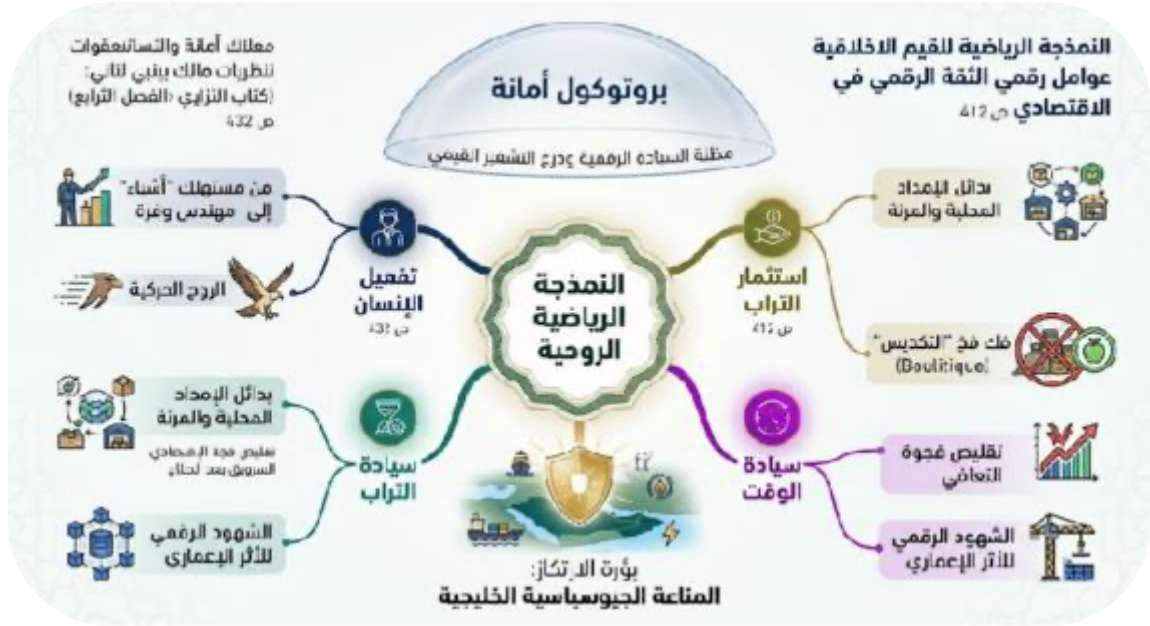
شكل رقم ٢: خريطة ذهنية بصرية - عملية النمذجة الرياضية لـ "الأمانة"

تجسد هذه الخريطة الذهنية البصرية التكامل المنهجي بين قوانين الحركة عند ابن نبي (ابن نبي، ١٩٥٩) وبين النمذجة الهندسية لبروتوكول أمانة؛ حيث لا تكتفي المناعة الجيوسياسية بتوفير موارد بديلة (التراب)، بل تشترط وجود "وعاء سيادي" (عرايبي، ٢٠٢٦، ص ٤٣٢) يربط بين كفاءة الإنسان وسرعة الاستجابة الزمنية لضمان حصانة الكود الاقتصادي للدولة.