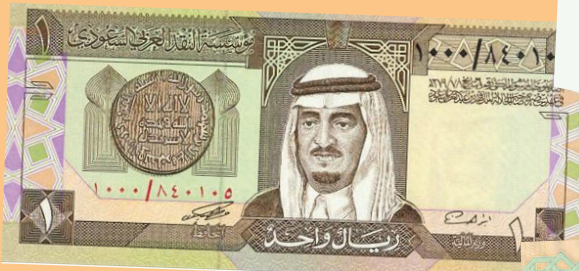
الإصدار الرابع: في عهد الملك فهد بن عبدالعزيز - رحمه الله-