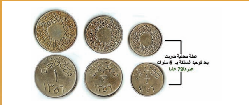
عملة معدنية ضربت بعد توحيد المملكة بـ 5 سنوات عمرها 72 عاماً