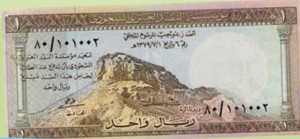
الإصدار الأول: في عهد الملك سعود بن عبدالعزيز - رحمه الله-