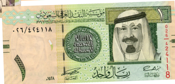
الإصدار الخامس في عهد الملك عبدالله بن عبدالعزيز - حفظه الله-