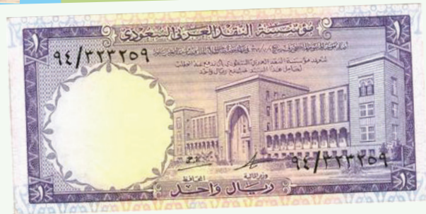
الإصدار الثالث: في عهد الملك خالد بن عبدالعزيز - رحمه الله-