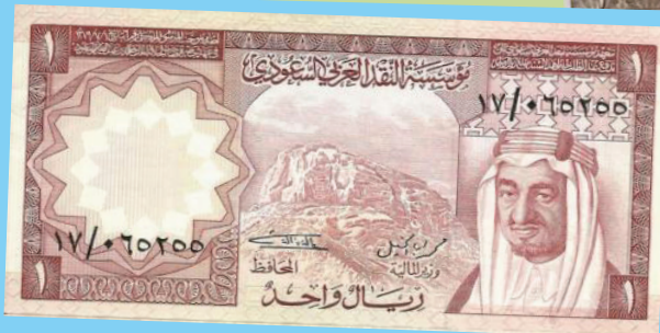
الإصدار الثاني: في عهد الملك فيصل بن عبدالعزيز - رحمه الله-